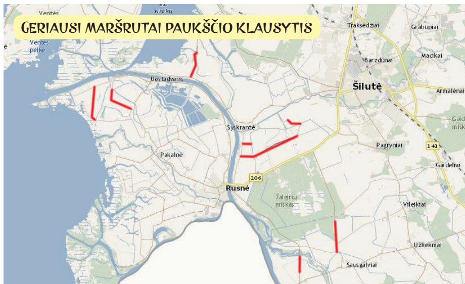
Žemėlapis iš svetainės www.maps.lt