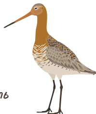
○ Большой веретенник