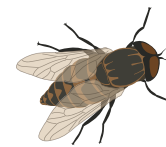
○ Слепень бычий