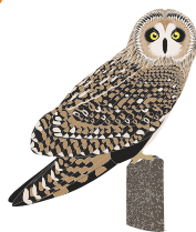
○ Болотная сова