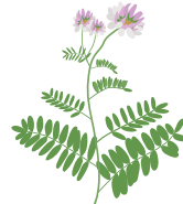
○ Вязель разноцветный