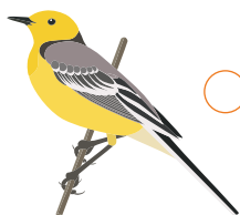
○ Желтоголовая трясогузка