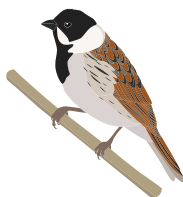
○ Тростниковая овсянка