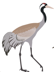
○ Серый журавль