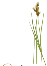
○ Осока теневая