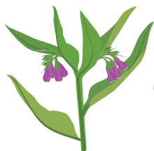
○ Окопник лекарственный