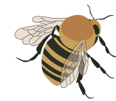
○ Шмель моховой