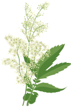
○ Таволга взлоистная