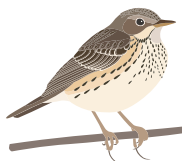
○ Луговой конек