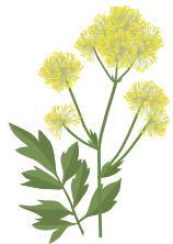
○ Василистник желтый