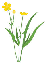
○ Лютик длиннолистный