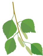
○ Береза пушистая