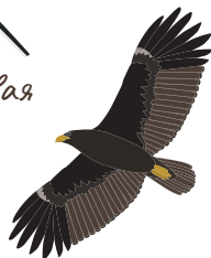
○ Большой подорлик