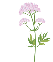
○ Валериана лекарственная