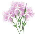
○ Гвоздика пышная