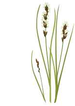
○ Осока сближенная