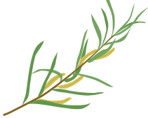
○ Ива розмаринолистная