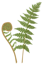
○ Щитовник болотный