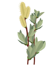
○ Ива лапландская