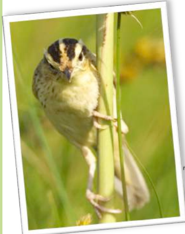
Skiriamasis meldinės nendrinukės

Įdomu! Meldinei nendrinukei vardą davė žymus gamtininkas Tadas Ivanauskas. Visgi, jis yra labiau klaidinantis, nei apibūdinantis – meldinės nendrinukės neturi nieko bendra nei su meldais, nei su nendrėmis (na, nebent tai, kad patinėliai kartais gieda nendrių viršūnėse, ir kad norint išsaugoti šį giesmininką, šių augalų sąžalynai nepageidaujami). Kitose kalbose šio paukščio vardas labiau informatyvus – jis siejamas su vandeniu (angl. Aquatic warbler ), vikrumu (rus. Вертявая камышевка ), viksvomis (vok. seggenrohrsänger ).