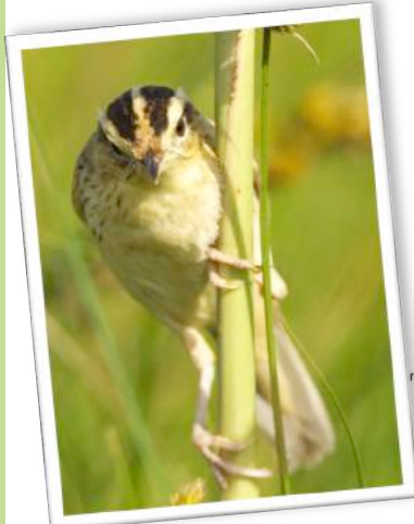
Skiriamasis meldinės nendrinukės bruožas – gelsva juosta viršugalvyje

Įdomu! Meldinei nendrinukei vardą davė žymus gamtininkas Tadas Ivanauskas. Visgi, jis yra labiau klaidinantis, nei apibūdinantis – meldinės nendrinukės neturi nieko bendra nei su meldais, nei su nendrėmis (na, nebent tai, kad patinėliai kartais gieda nendrių viršūnėse, ir kad norint išsaugoti šį giesmininką, šių augalų sąžalynai nepageidaujami). Kitose kalbose šio paukščio vardas labiau informatyvus – jis siejamas su vandeniu (angl. Aquatic warbler ), vikrumu (rus. Вертявая камышевка ), viksvomis (vok. seggenrohrsänger ).