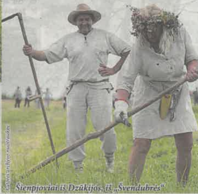
Šienpjoviai iš Dzūkijos, iš „Svendubrės“

mesio skirti vietinėms mažesnėms varžyboms, kurias organizuoja vietos bendruomenės. Tad kiti metai bus savotiškas ruošimasis, atrankos, o 2026 m. vėl visi susitiksime pamatyti, kaip patobulėjome, kokių naujų šienpjovių išugdėme. Taip pat svarstome galimybę teikti paraišką, kad šienavimo dalgiu tradicija būtų įtraukta į nematerialaus kultūros paveldo vertybių sąvadą, – apie sprendimą keisti čempionato dažnį sakė Ž. Morkvėnas.