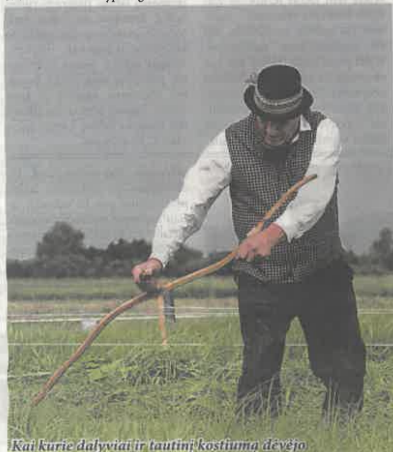
Kai kurie dalyviai ir tautinį kostiumą dėvėjo