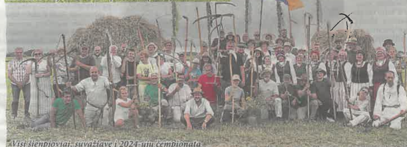
Visi šienpjoviai, susažiuavę į 2024-ųjų čempionatą