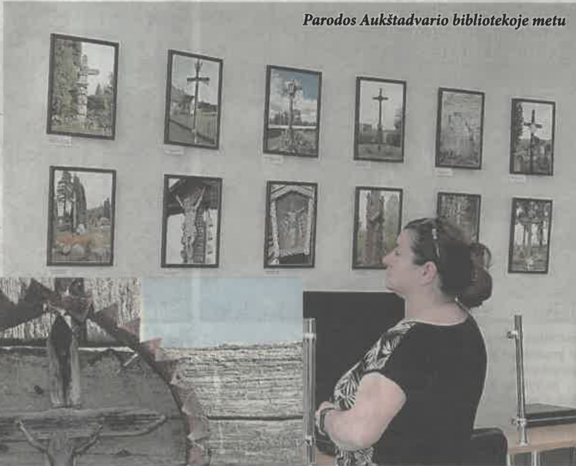
Parodos Aukštadvario bibliotekoje metu

Iš surinktos fotografuotos medžiagos buvo atrinkti reikšmingi darbai ir paruošta fotografijų paroda „Mediniai kryžiai Aukštadvario apylinkėse“. Šiuo metu ši paroda eksponuojama Aukštadvario bibliotekoje, vėliau keliaus į Dzūkijos-Suvalkijos saugomų teritorijų direkcijos lankytojų centrus, Bijūnų, Užuguosčio, Vyšniūnų bibliotekas.