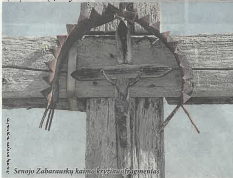
Senojo Zabarauskų kaimo kryžiaus fragmentas

Daugiausia – tradicinių kryžmiškų kryžių, kurių nemažai, ypač naujesniųjų, yra padarę nevietiniai meistras. Vietiniams, greičiausiai kaimo, kryždirbiams priskirtina dauguma aukštų, stambių kons-